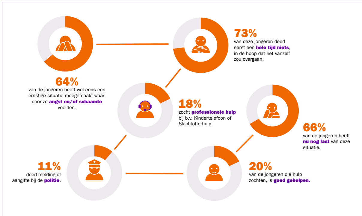
Afbeelding: resultaten surveyonderzoek jongerenadvies team

Tijdens het FOCUS project is ook een surveyonderzoek van het Nederlandse jongeren advies team gepubliceerd. Voor de volledige rapportage wordt verwezen naar de website van Defence for Children. 13 Ten behoeve van deze startnotitie wordt volstaan met het tonen van de infographic behorend bij het rapport (zie afbeelding hieronder).