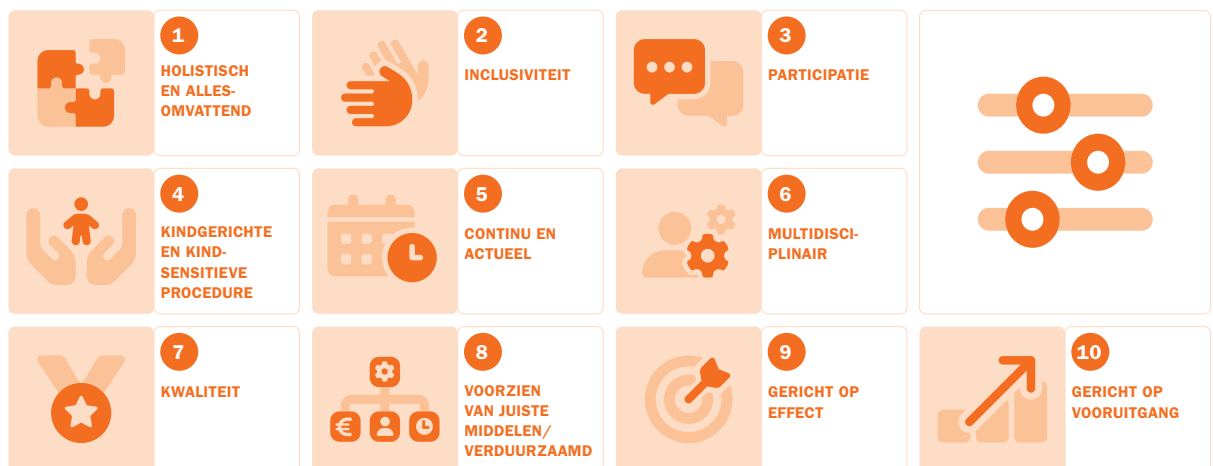
Afbeelding: 10 parameters (2025)

Voor een volledige toelichting per parameter en de totstandkoming ervan wordt verwezen naar het apart opgemaakte document over de FOCUS Parameters (bijlage 1). Ten behoeve van de leesbaarheid van dit rapport wordt hieronder volstaan met een samenvatting.