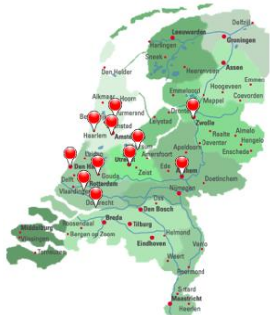
Afbeelding 1: Geografische analyse vragenlijst

Medewerkers van de (toegang tot de) gemeentelijke opvang en van partijen binnen de jeugdzorg noemen ook huisuitzettingen en persoonlijke omstandigheden, zoals multiproblematiek, psychische problematiek en een licht verstandelijke beperking als mogelijke redenen voor dakloosheid. Gezinnen waarbij sprake is van persoonlijke problematiek komen in het algemeen eerder in aanmerking voor opvang dan de hiervoor genoemde typen gezinnen. Het project besteedt derhalve meer aandacht aan de groep 'economisch dakloze' gezinnen met kinderen.