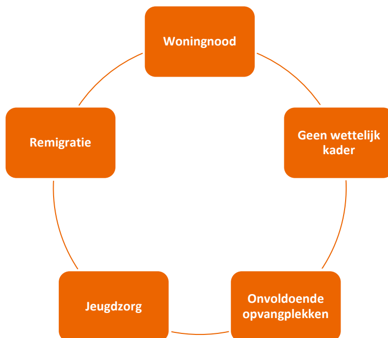
Afbeelding 2: knelpunten

De stakeholders ervaren verschillende knelpunten bij (dreigende) dakloosheid van gezinnen met kinderen. De grootste knelpunten zijn volgens hen (zie afbeelding 2):