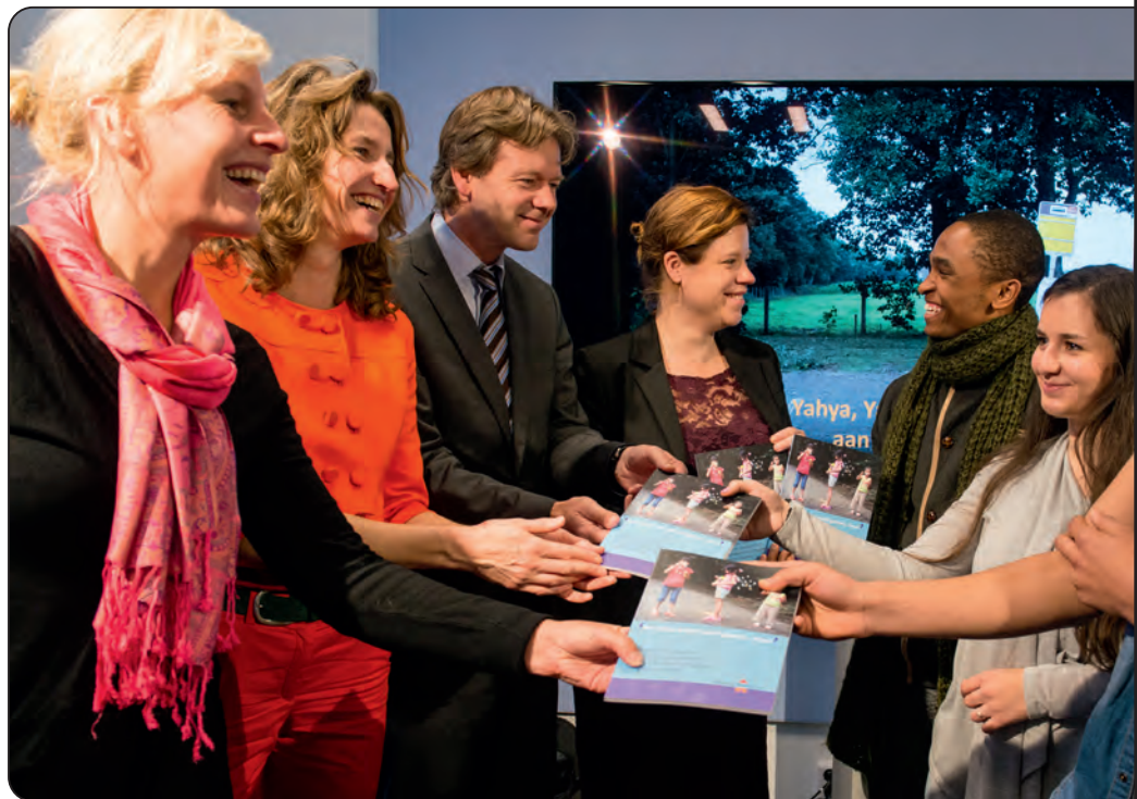
Op 5 november 2014 overhandigden jongeren uit gezinslocaties het rapport 'Het is hier in één woord gewoon... stom!' aan leden van de Tweede Kamer.

Het VN-Kinderrechtencomité benadrukt dat het recht om gehoord te worden niet voortvloeit uit het feit dat kinderen kwetsbaar zijn of afhankelijk van volwassenen. Het geeft kinderen eigen rechten. Daarom moet het mogelijk zijn voor kinderen en jongeren om naar gelang hun leeftijd inspraak te hebben, invloed uit te oefenen, zaken goed te keuren, of juist af te keuren.